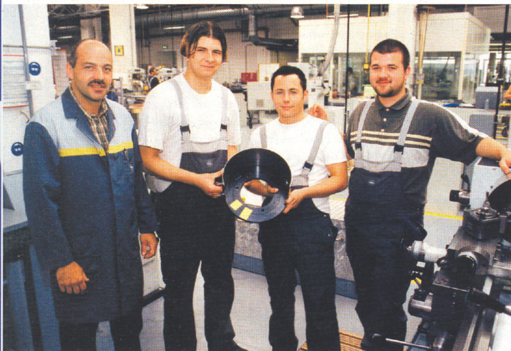
Der erste Preis für einen neuen Spannfutterschutz an der Drehmaschine ging an das Team der Adam Opel AG