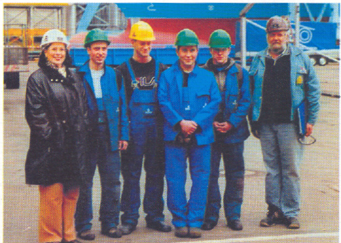
Die Gruppe der Howaldtswerke-Deutsche Werft AG wurde für eine neuartige Schweißrauchabsauganlage mit dem dritten Preis belohnt

Der Deutsche Jugend-Arbeitsschutz-Preis geht in die zweite Runde: Zurzeit läuft eine Informationskampagne an den Berufsschulen. Aktuelle Hinweise zu den Teilnahmemodalitäten sind auch auf den Internetseiten der